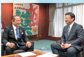
藤井先生門下生の仲間である本村賢太郎相模原市長と市政の課題を意見交換。