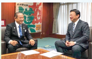
藤井先生門下生の仲間である本村賢太郎相模原市長と市政の課題を意見交換。