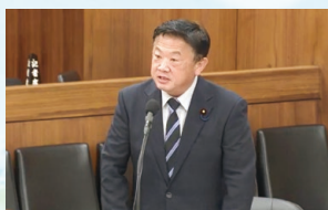
国会では地元の代弁者として、生活者の声・現場の声を積極的に発言しました。