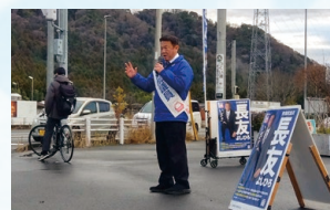
街頭演説のオトコ。来る日も来る日も交差点や駅前です実施。